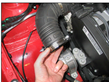
Fig. # 8