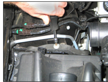
Fig. # 3