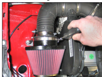
Fig. # 13