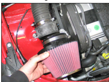
Fig. # 12