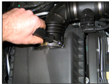
Fig. # 2