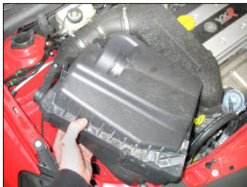
Fig. # 4