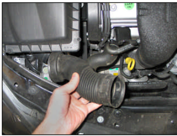
Fig. # 1

FILTER MAINTENANCE: K&N suggests checking the filter periodically for excessive dirt build-up. When the element becomes covered in dirt (or once a year), service it according to the instructions on the Recharger service kit available from your K&N dealer, part number 99-5003EU.