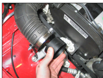
Fig. # 9