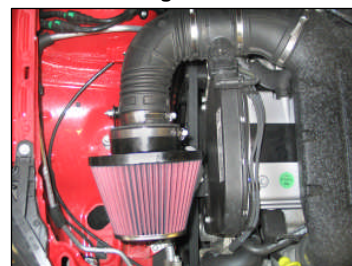
Fig. # 14

Technical Support please send an email to: eindhoven.tech@knfilters.com