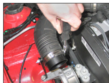
Fig. # 10