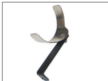
Fig. # 5