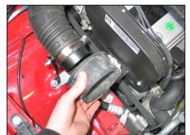
Fig. # 11